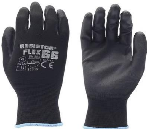
GUANTE PALMU PU $730