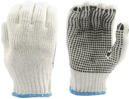
GUANTE DE HILO PIGMENTADO 2 HEBRAS $420