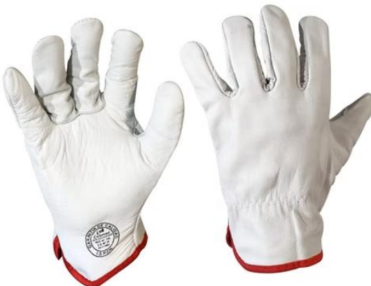
GUANTE CABRITILLA NATURAL SIN FORRO $1.890