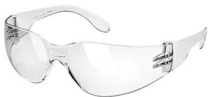
LENTE SPY CLARO - OSCURO PROTECCION UV $900