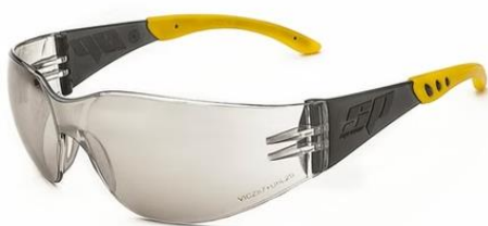
LENTE FLEX CLARO GRISI IN OUT $1.490