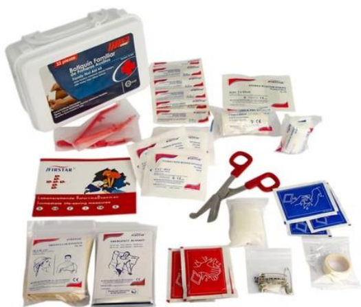
BITIQUIN 32 PIEZAS CODIGO ROJO, PARA REALIZAR PRIMEROS AUXILIOS $10.800