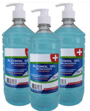
ALCOHOL GEL 1 LITRO CON DISPENSADOR $2.500