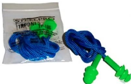
TAPON AUDITIVO TIPO PINO CON CORDON $350