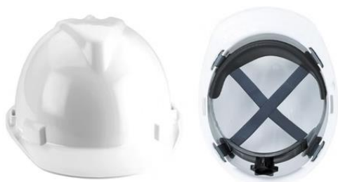
CASCO SEGURIDAD MPC 221PLUS CON ARNES DE CINTA $4.500