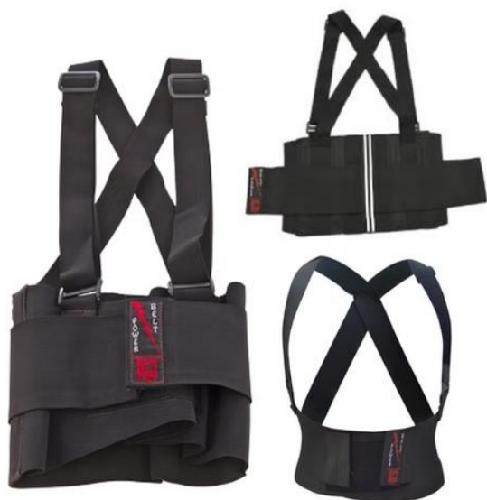
FAJA LUMBAR DEMEDICO CALIFICADO, LIMITA LA FLEXION PELVICA SEGURIDAD ELASTICA $6.990