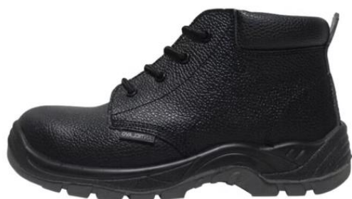
BOTIN POWER FULL TALLA 35-46 $16.200