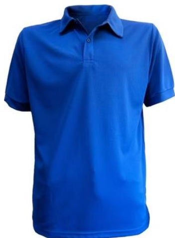
POLERA PIQUE MANGA CORTA AZUL MARINO, AZUL REY, GRIS, ROJO, NEGRO $5.500