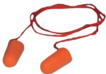
TAPON AUDITIVO DE ESPUMA DESECHABLE $290