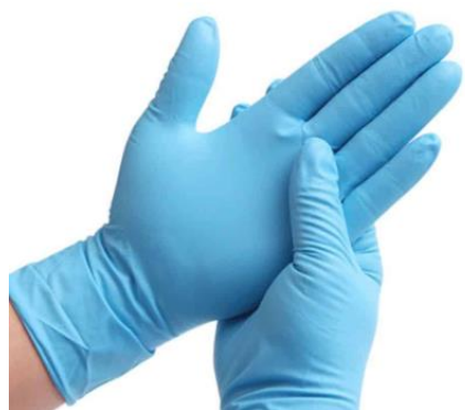
GUANTE NITRILO AZUL TALLA S-M-L $3.900