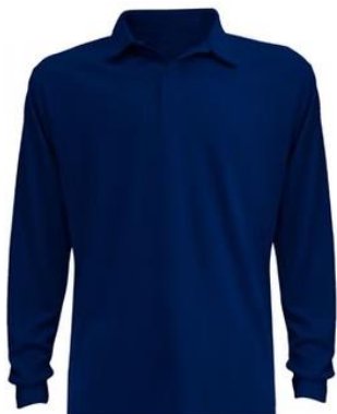
POLERA PIQUE MANGA LARGA AZUL MARINO, GRIS, ROJO, AZUL REY, NEGRO $6.100